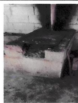
Foto 2: Sustitución de estufa y chimenea, pintura de cocina, instalación de Polletón, cambio de lámina y reparación de ventanas y puertas