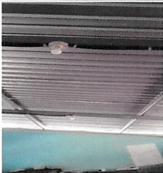
Foto1: Refuerzo de en estructura existente (Costaneras y tornillos)