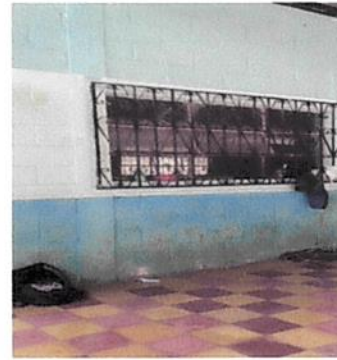
Foto 4: Sustitución de pintura, reparación de puertas y ventanas de la escuela, lámina de galera.